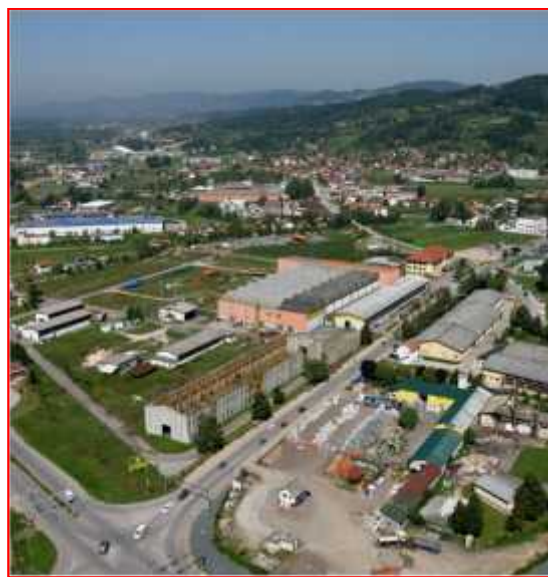
PROGRAM KAPITALNIH INVESTICIJA OPĆINE GRAČANICA ZA PERIOD OD 2016. do 2020.GODINE

IZVJEŠTAJ O REALIZACIJI PROJEKATA U 2015.GODINI KOJI SU REALIZOVANI U PERIODU IZME U PKI 2010-2014 I PKI 2016-2020