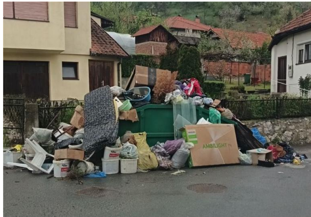
Slika 9: Krupni otpad

Iako je u ove kontejnere zabranjeno odlaganje otpadnog građevinskog materijala i šljake nego se njihov odvoz reguliše vanrednim odvozom na deponiju ili ugovorom o odvozu šljake za sezonu imamo situacije da velike količine ove vrste otpada završava u ili oko kontejnera za krupni otpad.