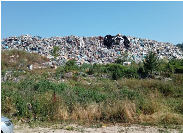
Slika 20: Deponija Grabovac (07. juli 2021. god.)

Pored toga intezivno radimo na prekrivanju deponije sa inertnim materijalom. To je privremeno rješenje da se smanji negativan uticaj deponije na okolinu dok se ne iznađu finansijska sredstva za njenu sanaciju (slika 20. i 21.).