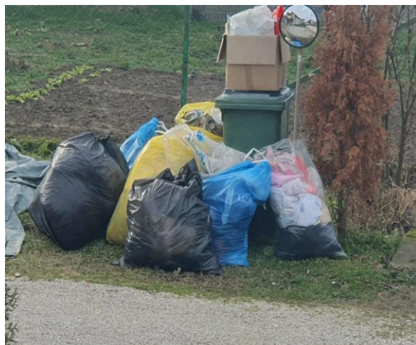
Slika 3: Otpadna odjeća i obuća