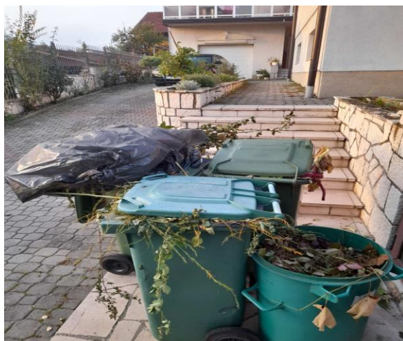
Slika 5: Biljni otpad

Ova vrsta otpada zahtijeva vanredan odvoz ili uključivanje u odvoz šljake od centralnog grijanja koja se vozi odvojeno od komunalnog otpada.