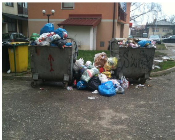
Slika 7: Posude za zamjenu

Jedan kontejner 1100 litara može zadovoljiti potrebe 10 domaćinstava. Pošto u svim stambenim naseljima ima reciklažno dvorište, samim odvajanjem otpada stanari bi smanjili količine u kontejnerima za komunalni otpad i ovaj broj posuda bi bio dovoljan ali oni to ne čine.