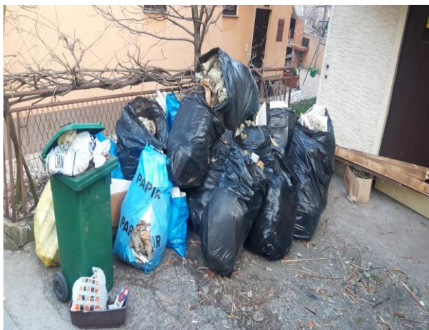
Slika 2: Građevinski otpad