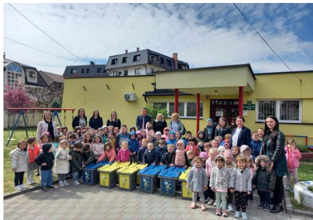
Slika 14: Predaja kanti u obdaništu

d) Svim odgojno-obrazovnim ustanovama (obdaništu, osnovnim i srednjim školama) obezbijedili smo plavu i žutu kantu zajedno sa vrećama za odvajanje ambalažnog otpada a odvoz prikupljene ambalaže vršimo po pozivu od strane eko sekcije ili u redovnim terminima odvoza ambalažnog otpada (slika 14. i 15.)