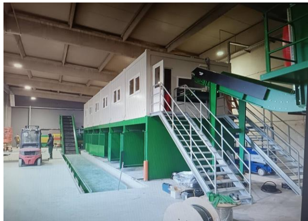
Slika 19: Sortirnica

U septembru 2023. godine započeli smo odvoz i deponovanje komunalnog otpada na regionalnu deponiju Karabegovac u Doboju.