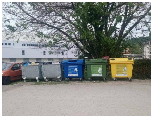
Slika 13: Set kontejnera u stambenim naseljima

Trenutno imamo 23 reciklažna ostrva sa kontejnerima na slijedećim lokacijama (Tabela 11.):