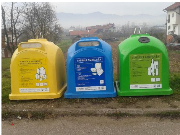
Slika 12: Reciklažna ostrva – zvona