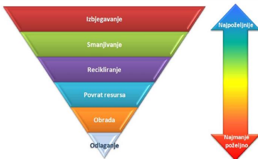
Slika 1: Hijerarhija upravljanja otpadom

deponiji. U skladu sa Federalnom strategijom, osnovni koncept koji treba usvojiti baziran je na hijerarhiji postupaka tretmana otpada koji su sastavni dio integralnog sistema upravljanja otpadom prikazanoj na slici 1.