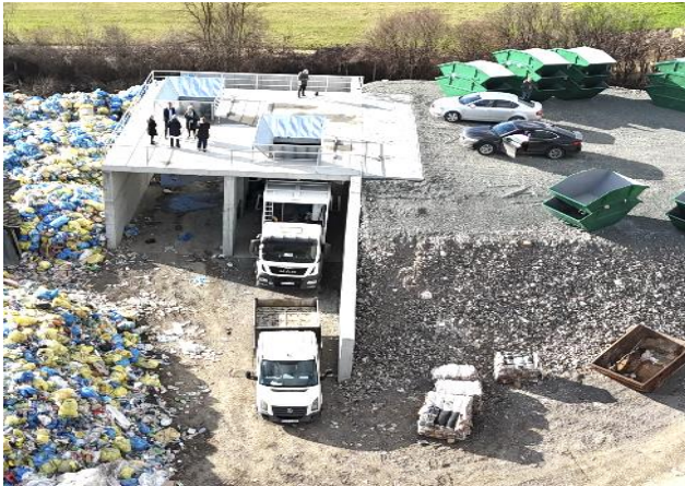
Slika 18: Pretovarna stanica sa kamionom i poluprikolicom

sortirnici će koštati 869.661,00 KM a novi predračun za objekat je u fazi izrade (Slika 19.) tako da moramo što prije obezbijediti ostala finansijska sredstva kao bi realizovali projekat nabavke sortirnice.