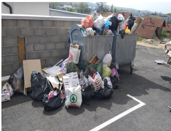
Slika 6: Nedovoljan broj posuda