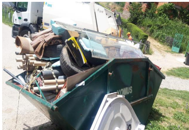
Slika 8: Krupni otpad

Odučeno je ukupno 128 kontejnera krupnog otpada.