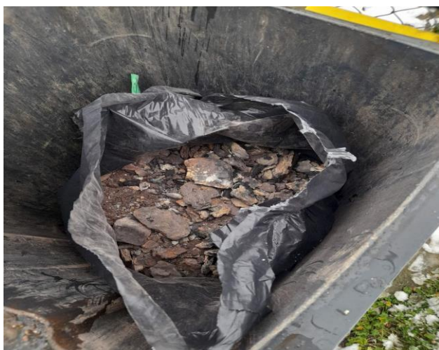
Slika 4: Šljaka