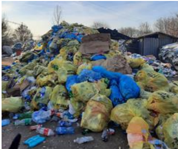
Slika 16: Dovučen ambalažni otpad