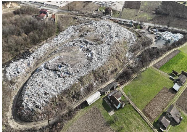
Slika 21: Deponija u Grabovac (21. februar 2024.god.)

Radno vrijeme deponije je od 07-15 h svim radnim danima. Na ulazu je postavljen video nadzor zbog kontrole ulaza i izlaza sa deponije. Sva vozila moraju izvagati otpad na kolskoj vagi a ukoliko otpad dovoze treća lica provjeri se i vrsta otpada koji odlažu na deponiji. Samostalni dovoz otpada na deponiju naplaćuje se po važećem cjenovniku.