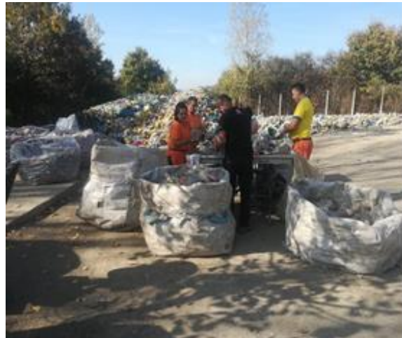
Slika 17: Razdvajanje ambalaže

Ogroman broj vreća dolazi svaki mjesec na reciklažno dvorište što terenu zaposleni ne mogu sustići razvrstati i balirati pa su se određene količine ambalaže nagomilale, posebno zato što zaposlenici imaju obaveze oko pretovarne stanice i na vaganju ulaza trećih lica na deponiju.