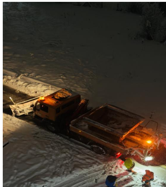
Slika 10: Razgrtanje snijega na ulicama

Najveće probleme i zastoje na saobraćajnicama naprave vozači bez zimske opreme koji izazovu zastoje na putevima i uspore aktivnosti zimske službe. Otežano kretanje vozila zimske službe je i zbog parkiranih vozila na ulicama jer zbog njih, u ionako uskim ulicama, moraju sporije raditi i teško mogu ukloniti snijeg sa saobraćajnice.