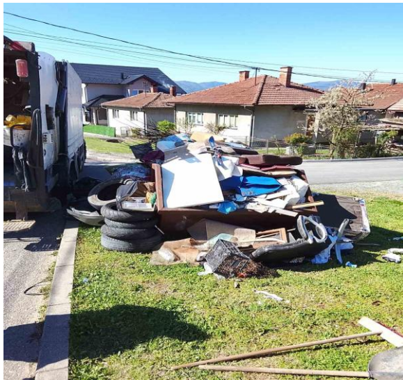
Slika 10: Krupni otpad

Odvučeno je ukupno 116 kontejnera krupnog otpada a otpad rasut oko kontejnera utovaran je u kamion autosmečar i kiper.