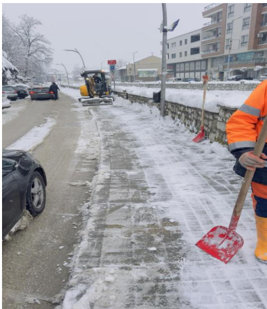
Slika 9: Uklanjanje snijega sa trotoara

U ovom izvještajnom periodu Program je realizovan kako je i predviđeno a na održavanju su angažovana 2 kamiona sa nožem i solarom, 4 traktora sa razgrtačem i solarom, radna mašina utovarivač, freza – bacač snijega, a vršeno je i ručno uklanjanje snijega i posipanje soli na trotoare, stepeništa, staze, mostove (slika 9 i 10).