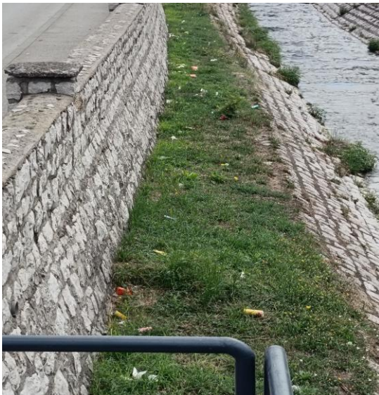
Slika 7: Otpad u minor koritu rijeke

Jednokratno je izvršeno krčenje od divljeg rastinja i čišćenje minor korita od bivšeg Lido osiguranja do mosta prema dvorani kod II Osnovne škole. Veliki problem kod ovih poslova je što na regulaciji rijeke nije ostavljena rampa za silazak vozila u korito, pješački mostovi su niski i ispod njih ne mogu proći radne mašine i sav otpad radnici moraju iznositi ručno u vrećama (preko penjalice) ili se moraju angažovati skupe specijalne mašine sa teleskopom.