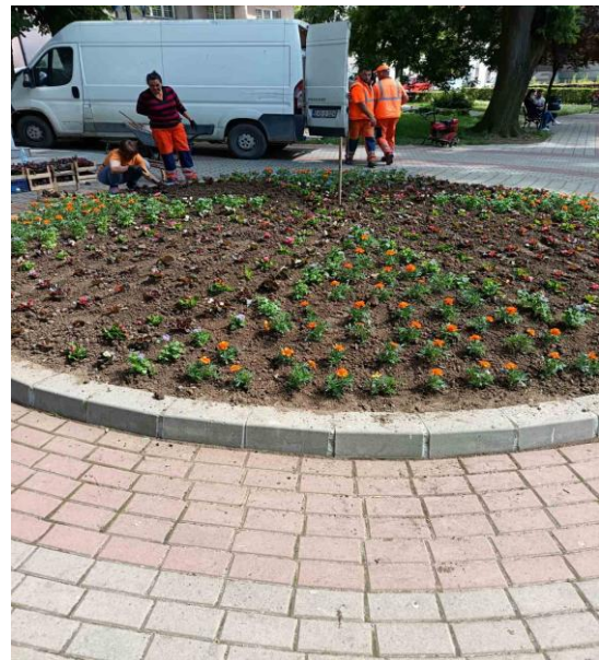
Slika 6: Uređenje cvjetnih gredica