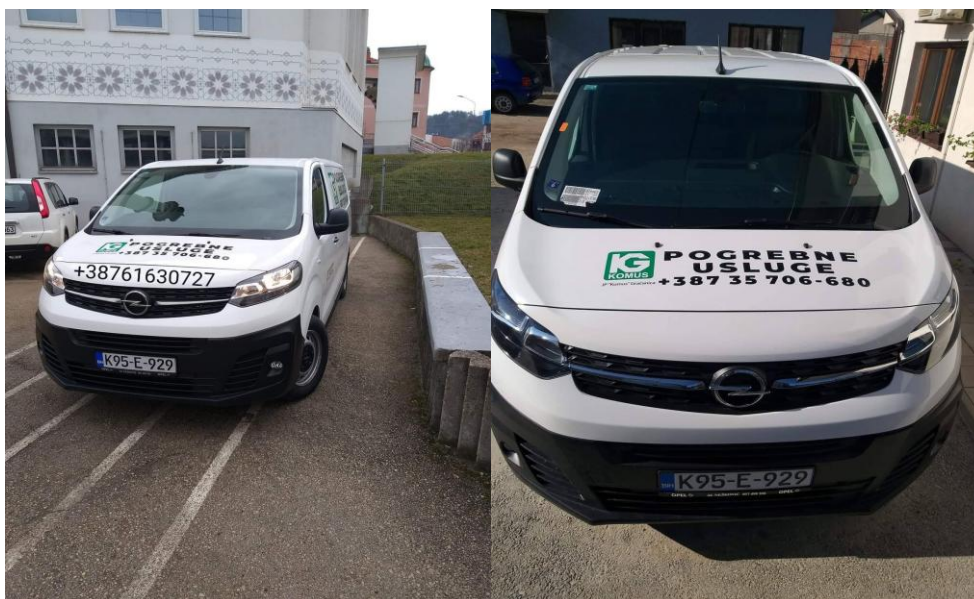
Slika 15: Pogrebno vozilo J.P. „KOMUS“ d.o.o.

U skladu sa potrebama grada izvršili smo nabavku novog pogrebnog vozila i započeli obavljanje prevoza preminulih (slika 15). U narednom periodu cilj nam je da se ne bavimo samo prevozom nego da ovu djelatnost unaprijedimo i da obezbjedimo uslove za pružanje kompletne usluge koju ova djelatnost treba da ima.