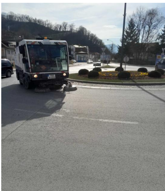
Slika 1: Čišćenje mašinski -čistilicom