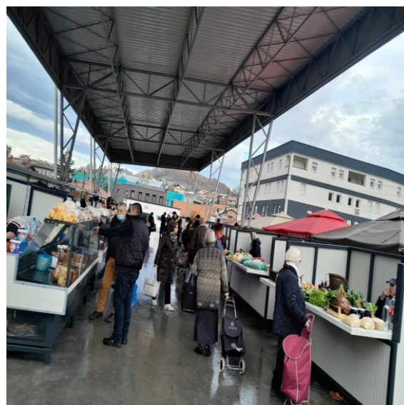
Slika 12: Nastrešica sa boksovima i frižiderima

U 2025. godini urađena je rasvjeta unutar nastrešice a postavljeni su i reflektori na vanjskoj strani nastrešice koji osvjetljavaju ostale prodajne stolove i štandove. Ovo je omogućilo prodavcima da svoju robu mogu bez problema dovući u ranim jutarnjim satima i izložiti prije nego što kupci počnu dolaziti. Sa rasvjetom se produžio period mogućeg ulaska tako da su se smanjile gužve u jutarnjim satima na ulaznoj kapiji zelene pijace.