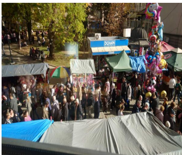
Slika 15: Vašer u Centru grada

Rješenjem o imenovanju Komisije broj: 02-16-02975-2025 od 14.10.2025. za praćenje aktivnosti kod organizacije tradicionalnog gračaničkog vašera 2025. godine u Gračanici, imenovano je 10 članova čiji je zadatak bio da provede sve aktivnosti na organizaciji vašera zajedno sa JP „Komus“ d.o.o. Gračanica kojem je povjerena neposredna organizacija, uključujući i rješavanje spornih situacija, parking prostora u saradnji sa ORVI-COMERC d.o.o. Gračanica, drugih pitanja i da ostvari saradnju sa PU Gračanica.