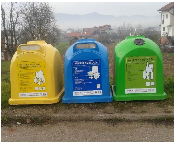
Slika 14: Reciklažna ostrva – zvona