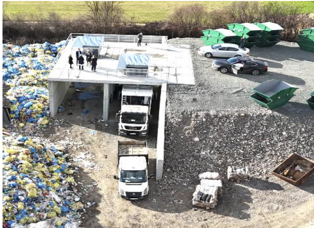
Slika 20: Pretovarna stanica sa kamionom i poluprikolicom