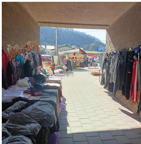
Slika 14: Ulaz na pijacu kroz haustor