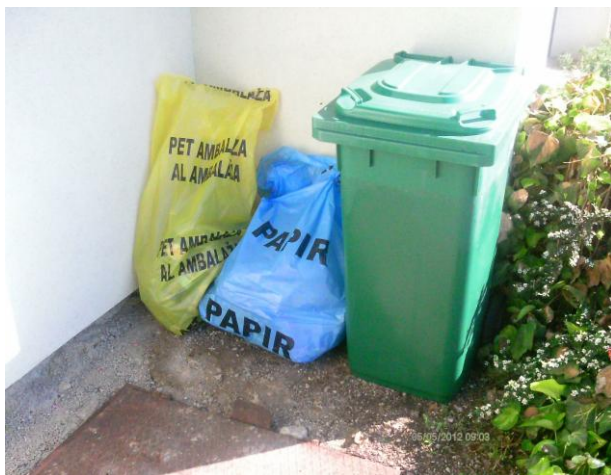
Slika 12: Odvajanje otpada na mjestu nastanka - u domaćinstvima