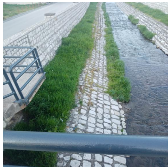
Slika 8: Minor korito prije košenja