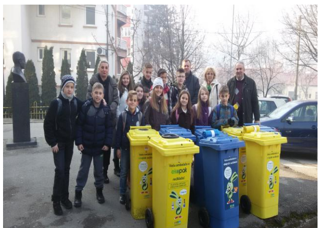
Slika 17: Predaja kanti u školi H.Kikić

Većina škola je samo preuzela kante i ovom projektu ne daju dovoljno pažnje ili se odvajanje ne vrši nikako. Potrebno je da se nastavno osoblje i ekološke sekcije zaduže da kontinuirano obnavljaju edukacije o razdvajanju otpada prilagođene uzrastu djece.