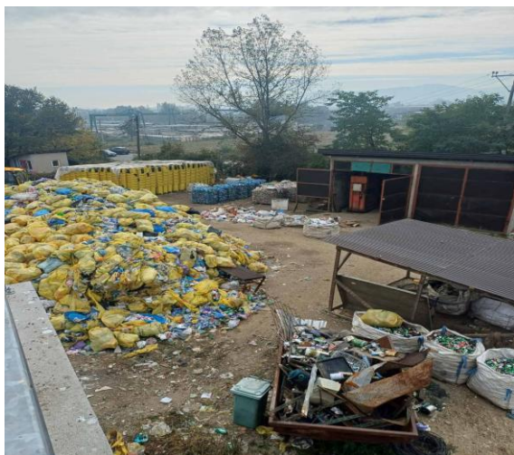
Slika 18: Inprovizovano „Reciklažno dvorište“