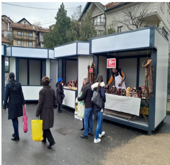
Slika 11: Kiosci za prodaju prehrane

U drugoj fazi uređenja gradske pijace, u skladu sa Glavnim projektom, Grad Gračanica je kroz projekat „Uređenje zelene pijace –Faza II“ obezbijedio sredstva za izgradnju nastrešice u koju su postavljeni boksevi sa tezgama i boksovi sa rashladnim vitrinama i 4 kioska za prodaju poljoprivrednih proizvoda (slika 11 i 12).