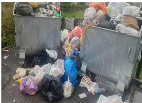
Slika 6: Nedovoljan broj kontejnera

Pored kontejnera od 1100 litara u stambenom naselju Grades, zgrade Vega, zgrada Džambo - Stubo i Kapetanuša (dogradnja) opredijelili su se za tipske kante.