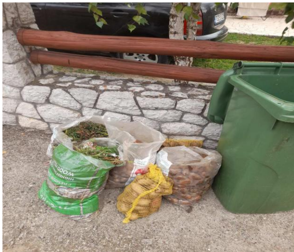
Slika 5: Biljni otpad

U kolektivnom stanovanju za odlaganje komunalnog otpada većinom se koriste kontejneri 1100 litara (hajfišeri) a njihova lokacija i broj, stanje kontejnera, broj korisnika i način odvoza dat je u Tabeli 5.: