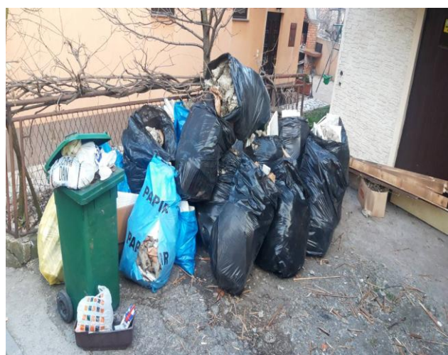
Slika 3: Građevinski otpad