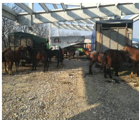
Slika 16: Stočni vašer

Istim Rješenjem u Komisiju za kontrolu rada po izdatim odobrenjima u dane vašera imenovana su 4 člana koji su takođe u saradnji sa J.P. «Komus» doo i PU Gračanica rješavali sporne situacije.