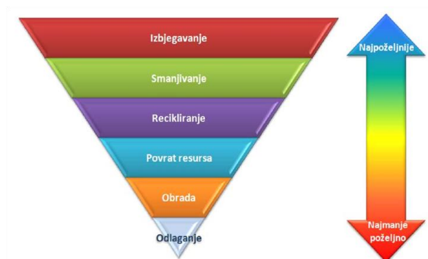
Slika 1: Hijerarhija upravljanja otpadom

deponiji. U skladu sa Federalnom strategijom, osnovni koncept koji treba usvojiti baziran je na hijerarhiji postupaka tretmana otpada koji su sastavni dio integralnog sistema upravljanja otpadom prikazanoj na slici 1.