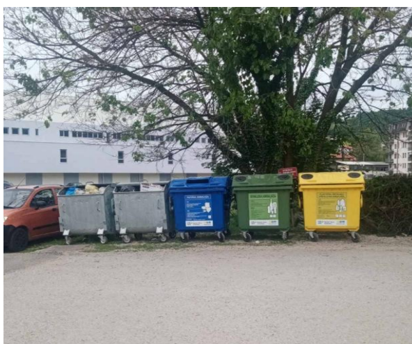
Slika 15: Set kontejnera u stambenim naseljima

Trenutno imamo 23 reciklažna ostrva sa kontejnerima na slijedećim lokacijama (Tabela 11.):