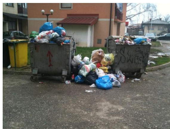
Slika 7: kontejneri za zamjenu

Pošto u svim stambenim naseljima ima reciklažno dvorište, samim odvajanjem otpada stanari bi smanjili količine u kontejnerima za komunalni otpad i ovaj broj posuda bi bio dovoljan ali oni to ne čine.