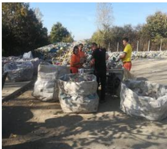
Slika 19: Razdvajanje ambalaže

Ogroman broj vreća dolazi svaki mjesec na reciklažno dvorište što trenutno zaposleni ne mogu sustići razvrstati i balirati pa su se određene količine ambalaže nagomilale, posebno zato što zaposlenici imaju obaveze oko pretovarne stanice i na vaganju ulaza trećih lica na deponiju.