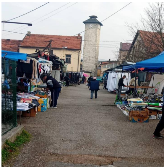
Slika 13: Na putu prema glavnom ulazu