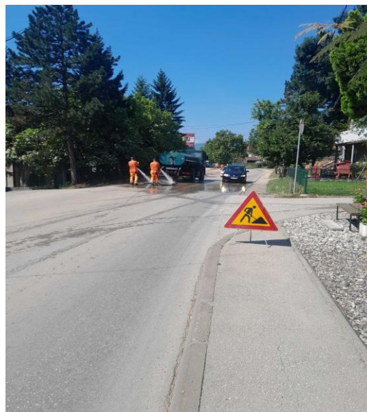
Slika 4: Pranje grada