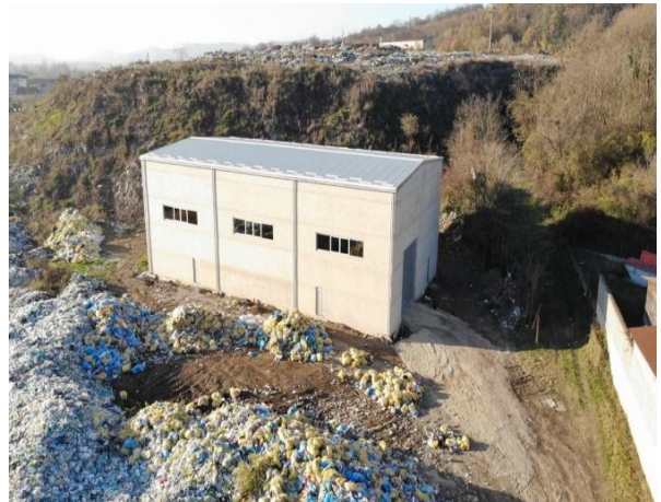
Slika 21: Objekat za sortirnicu

U septembru 2023. godine započeli smo odvoz i deponovanje komunalnog otpada na regionalnu deponiju Karabegovac u Doboju i još uvijek otpad se odlaže na tu regionalnu deponiju.