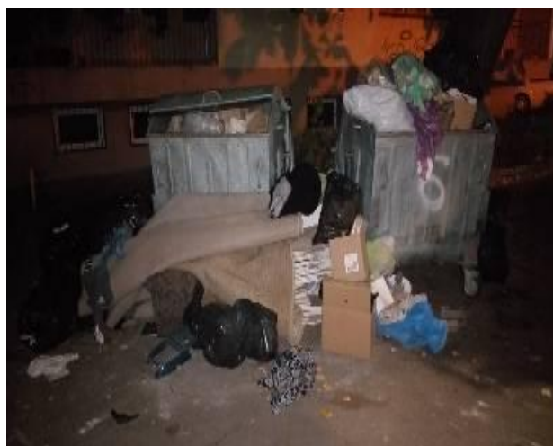
Slika 8: Kontejneri na Keju