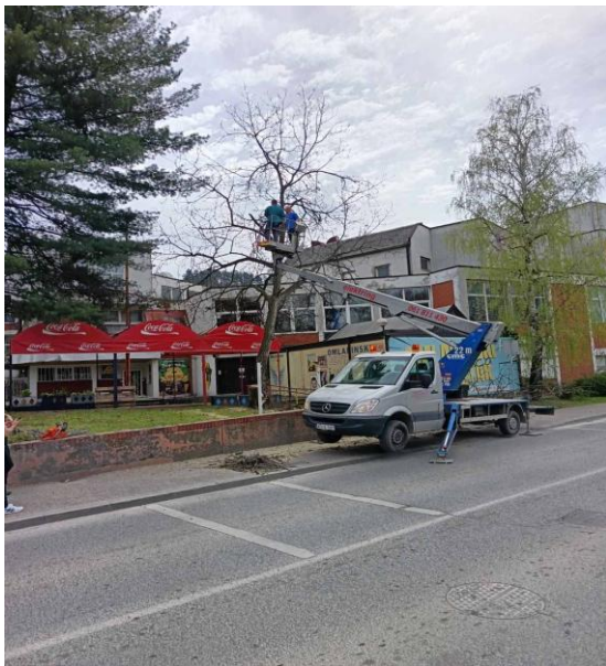
Slika 5: Orezivanje drveća