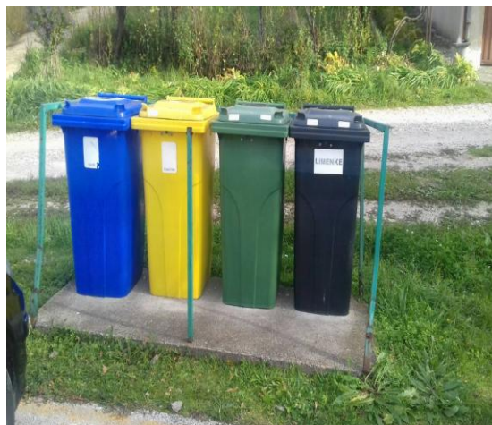
Slika 13: Reciklažna ostrva u manjim stambenim naseljima

b) U manjim stambenim naseljima i onim koji nemaju lokaciju za postavljanje seta kontejnera, postavljena su ostrva za reciklažu od 240 litarskih kanti namjenjenih za odvajanje ambalažnog otpada (slika 13.)