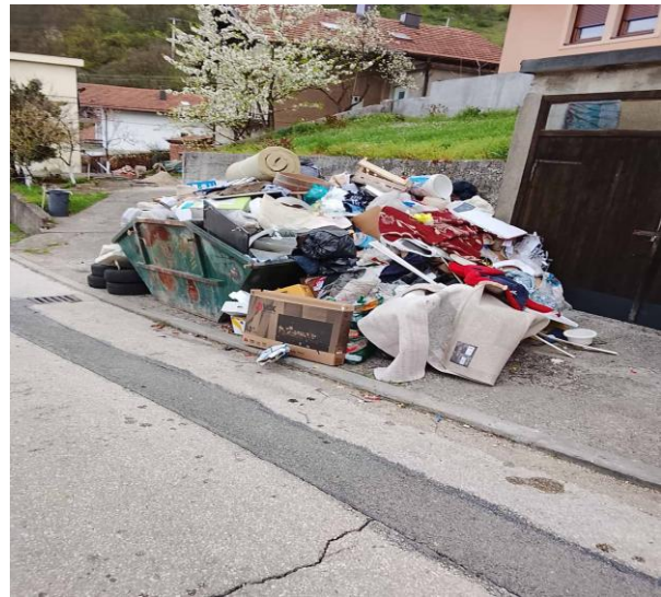
Slika 11: Krupni otpad

Iako je u ove kontejnere zabranjeno odlaganje otpadnog građevinskog materijala i šljake nego se njihov odvoz reguliše vanrednim odvozom na deponiju ili ugovorom o odvozu šljake za sezonu, imamo situacije da velike količine ove vrste otpada završava u ili oko kontejnera za krupni otpad.