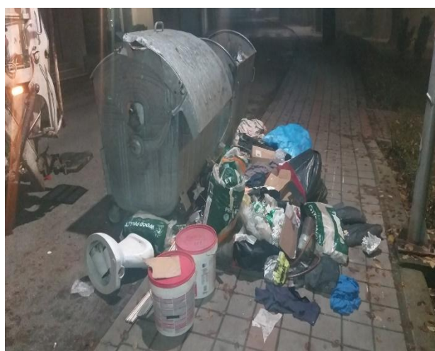
Slika 9: Kontejneri u ulici 22. Divizije