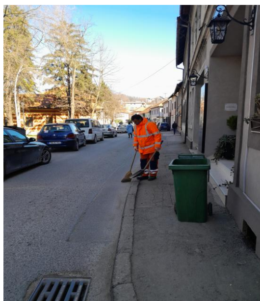
Slika 2: Čišćenje ručno

Kvalitet čišćenja direktno je zavisio od samog zaprljanja, broja pranja, stepena smetnji prilikom rada, načina, kao i broja čišćenja.