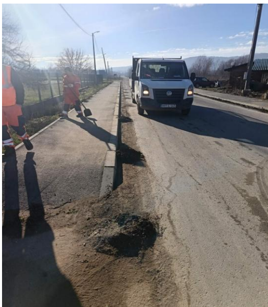
Slika 3: Uklanjanje posipnog materijala