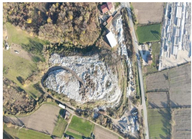
Slika 23: Deponija Grabovac (novembar 2025. god.)

Radno vrijeme deponije je od 07-15 h svim radnim danima. Na ulazu je postavljen video nadzor zbog kontrole ulaza i izlaza sa deponije. Sva vozila moraju izvagati otpad na kolskoj vagi a ukoliko otpad dovoze treća lica provjeri se i vrsta otpada koji odlažu na deponiji. Samostalni dovoz otpada na deponiju naplaćuje se po važećem cjenovniku.