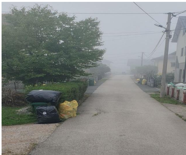
Slika 2: Uređen sistem odvoza otpada

Za prikupljanje komunalnog otpada individualna domaćinstva koriste tipske kante zapremine 80-120 litara te vreće iste zapremine (Slika 2).