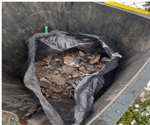
Slika 4: Šljaka

Ova vrsta otpada zahtijeva vanredan odvoz ili uključivanje u odvoz šljake od centralnog grijanja koja se vozi odvojeno od komunalnog otpada.